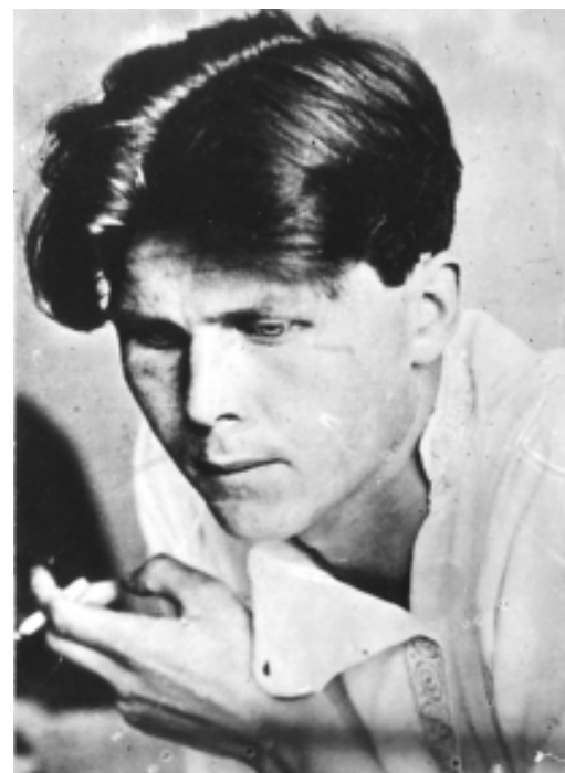
На снимке: А.Т. Твардовский, студент Смоленского пединститута, 1933 год.

Но сумки не скинул с плеча, Когда вернулся домой: Шел Кыш-барон на Поречье За этой самой землей. И вот я опять воюю, Но знаю, за что мне пасть, За землю свою родную, За рабоче-крестьянскую власть. И вместе пошел со мною Младший братенник мой. Земля! Мечта и отрада! Но годы ещё прошли, Покамест один, без брата, Добрая я до земли. Земля! Готовые были На ней леса и покос, Но мы на ней сотворили