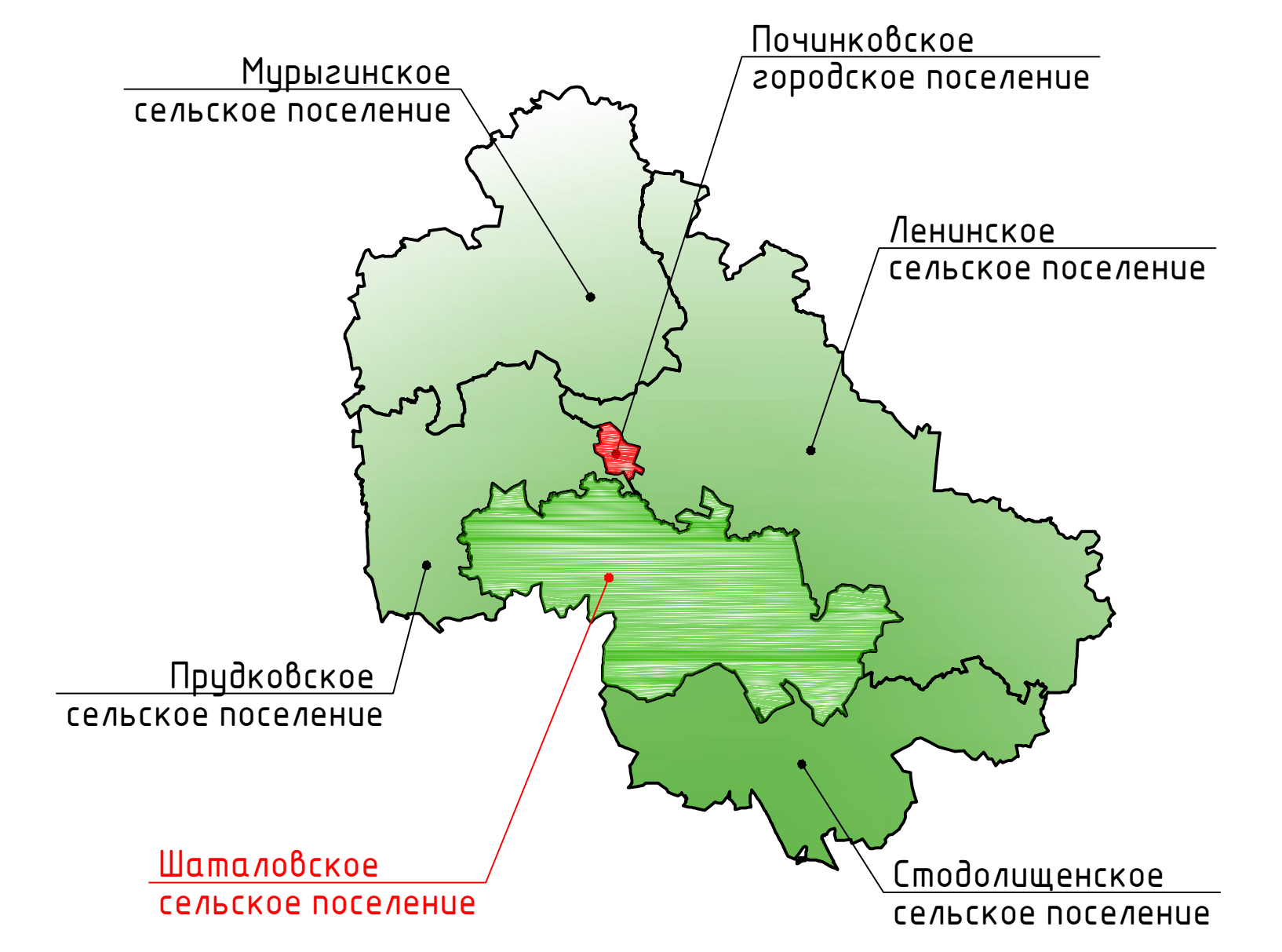
Схема расположения Шаталовского сельского поселения Починковского района Смоленской области

Карта градостроительного зонирования поселения. М 1:25000..