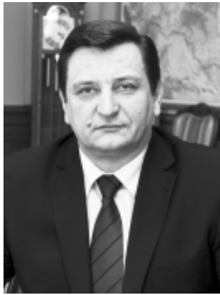
И.В. ЛЯХОВ, председатель Смоленской областной Думы.

Пусть в наступающем 2014 году сбываются самые заветные мечты! Желаю праздничного настроения, крепкого здоровья, счастья и удачи!