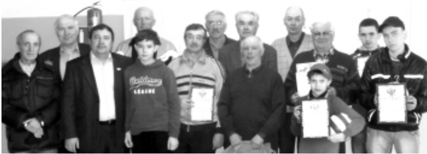
На снимке: участники и гости турнира.

В третий раз прошёл открытый турнир Васьковского сельского поселения по шахматам.