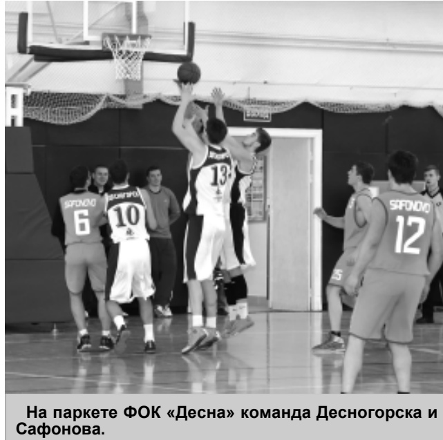
На паркете ФОК «Десна» команда Десногорска и Сафонова.

К общему знаменателю пришли, казалось бы, далекие друг от друга структуры – Смоленская АЭС и ЦБК «Динамо». Вместе они планируют развивать в Десногорске детско-юношеский баскетбол и сделать его спортом высших достижений.