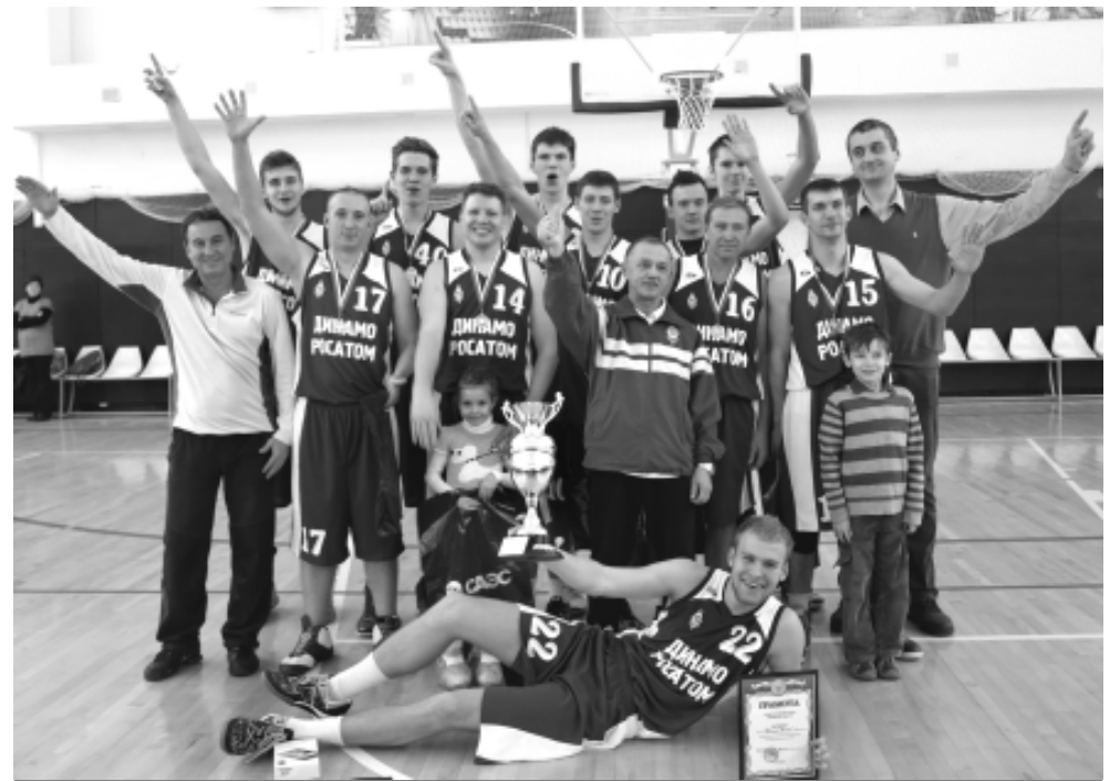
«Динамо-Росатом» – команда-победитель Кубка Смоленской области по баскетболу.

Накануне на паркет выходили подростки. Главные призы Кубка Смоленской АЭС собрала школа №3: сборные и девушек, и парней заняли первую ступеньку пьедестала. Вторые в зачетной таблице – девичья команда школы №2 и мальчишки из школы №1. Обладатели «бронзы» – команда юношей школы №2 и команда девочек школы №1. Четвертое место досталось школе №4, но ребята не унывают, тем более что без призов не остался никто. Именными кубками Евгения Гомельского за вклад в развитие детско-юношеского баскетбола награжде-