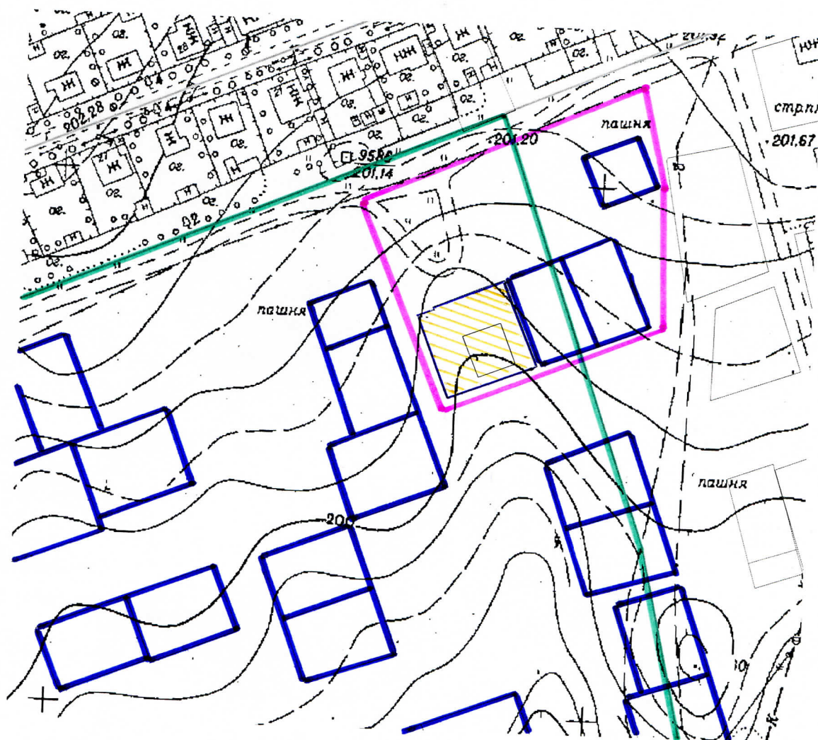
Схема расположения земельного участка в кадастровом квартале 67:14:0320250:

1203 кв.м. - площадь проектируемого земельного участка